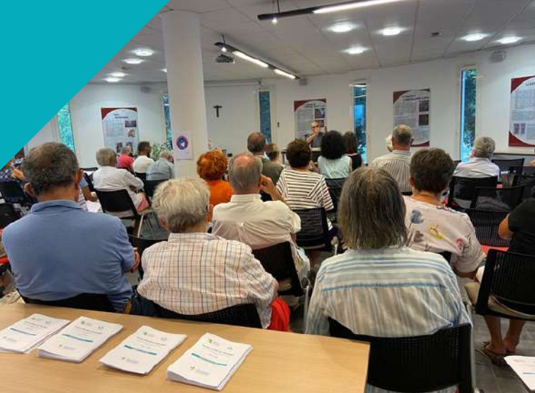
Conférences, séminaires, formations, assemblées générales...