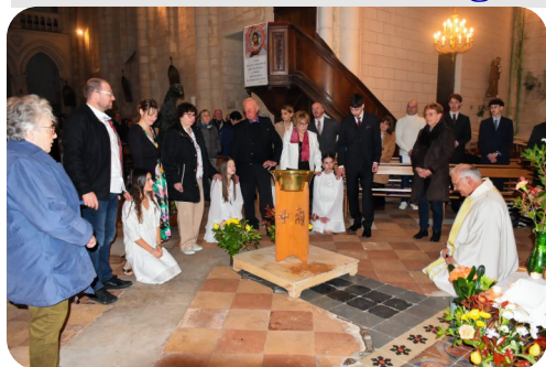
Trois jeunes filles ont demandé à connaître Jésus, le Christ, ont cheminé avec leurs accompagnatrices et sont entrées dans la famille des chrétiens, lors de la Vigile Pascale.