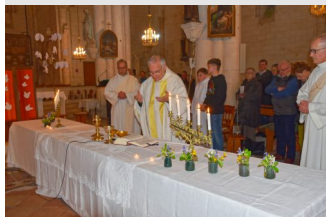
La table de la célébration de la Cène.