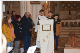
Les jeunes qui professeront bientôt leur foi nous invitent à la prière.