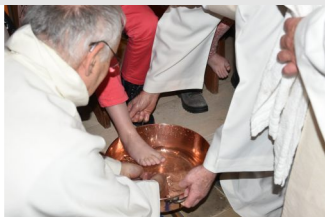
Lavement des pieds pour plusieurs enfants qui se préparent à la 1 ère des communions.