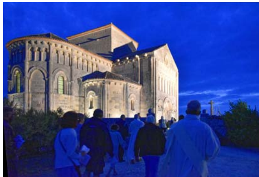
Arrivée de la procession de l'an dernier à Talmont

portés comme cet antique pèlerinage à l'ermitage Saint-Martial ou les processions mariales que nous aimons rejoindre à l'occasion de la fête de l'Assomption de Notre-Dame.