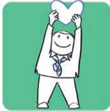
Grandir avec son cœur