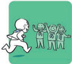
Grandir avec les autres