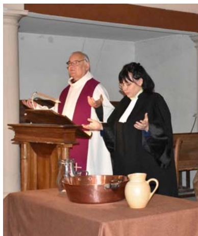
Photo prise lors de la cérémonie de janvier 2023